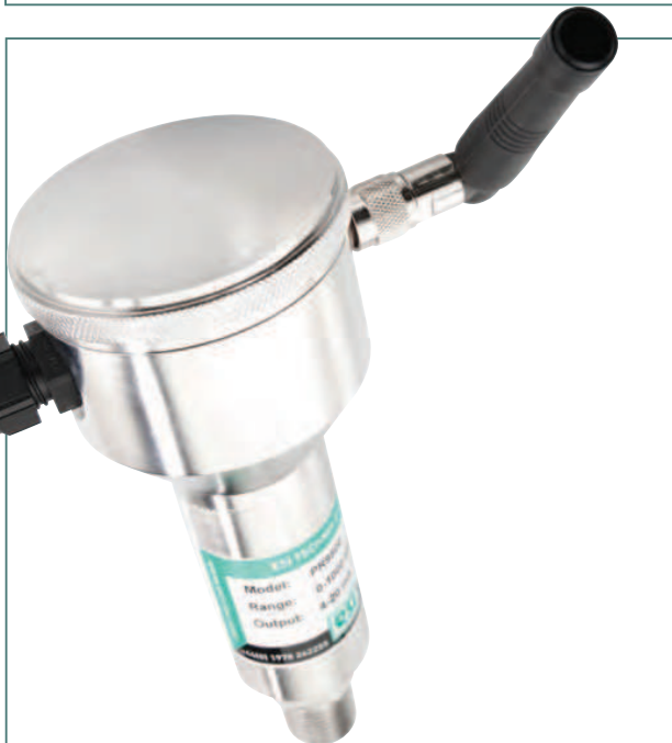
PR9500 è un trasduttore wireless per impiego in aree con condizioni critiche.

PR3915 control valve pressure transmitter (available redundant versions).