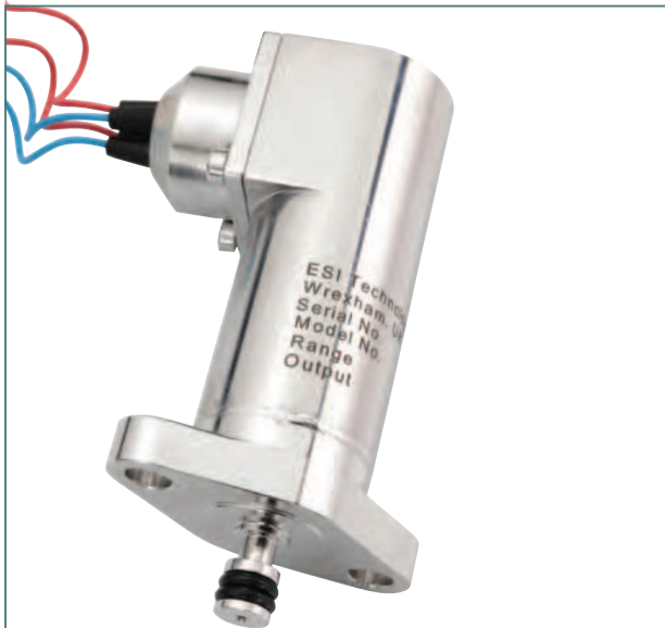
Trasduttore di controllo valvola (disponibile versione ridondante) modello PR3915.

PR3915 control valve pressure transmitter (available redundant versions).